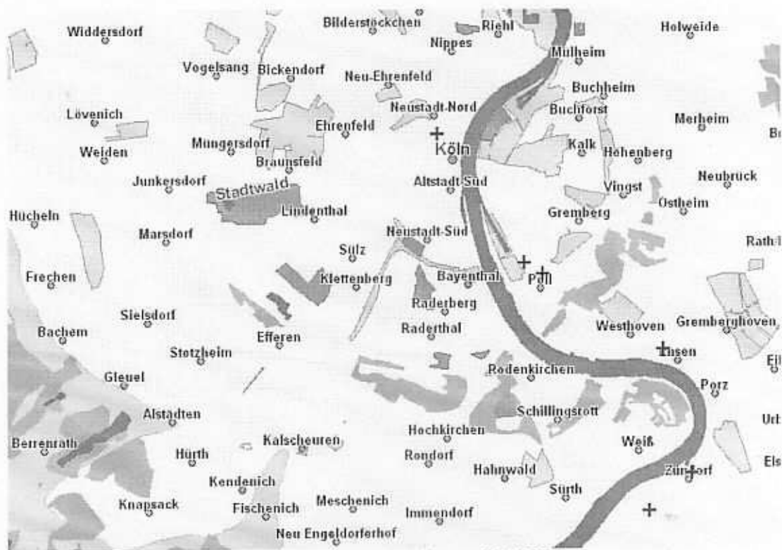
Der Familienname Lindenstock bei Köln

H. Dittmaier: Rheinische Flurnamen , Bonn 1963, S. 304 führt Stock als allgemein im rheinischen Raum verbreiteten Flurnamen an, darunter auch einen Beleg aus dem Jahr 1567 für einen Flurnamen Lindenstock in Gleuel bei Köln, der dem heutigen Familiennamen Lindenstock dieser Gegend zugrund liegen dürfte: